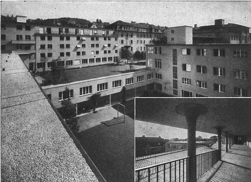
Schweizerische Pflegerinnenschule Zürich Architekten: Gebr. Pfister, Zürich Flachdach- und Terrassenbeläge ca. 4700 m 2 , ausgeführt durch die Asphalt-Emulsion A.-G., Zürich

Asphalt-Emulsion A.-G., Zürich Löwenstrasse 11 Telefon 5 88 66 Dachpappenfabrik und Unternehmung für wasserdichte Beläge