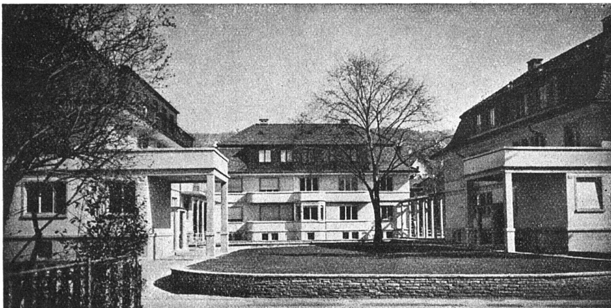
3 Mehrfamilienhäuser Hochstrasse, Zürich Arch. SIA Dr. E. Guhl

ZENT A. G. BERN, Fabrik für Zentralheizungsmaterial, Ostermundigen