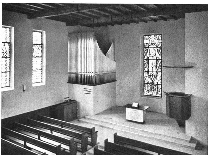
Intérieur vers le chœur

Installation des chauffages à l'air avec aérochauffeur électrique (Sulzer frères et Société des Forces électriques de la Goule à St-Imier). Les autres travaux ont été exécutés par les artisans de Villeret et de St-Imier. Travail de chômage avec subventions de la Confédération et du Canton.