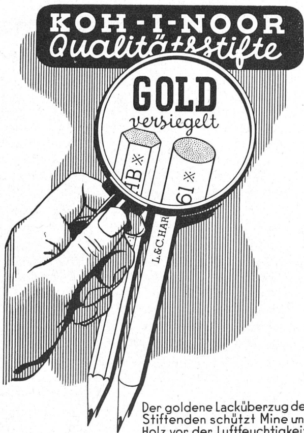
Der goldene Lacküberzug der Stiften schützt Mine und Holz vor der Luftfeuchtigkeit.