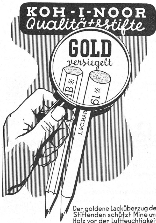
Der goldene Lacküberzug der Stiften schützt Mine und Holz vor der Luftfeuchtigkeit.