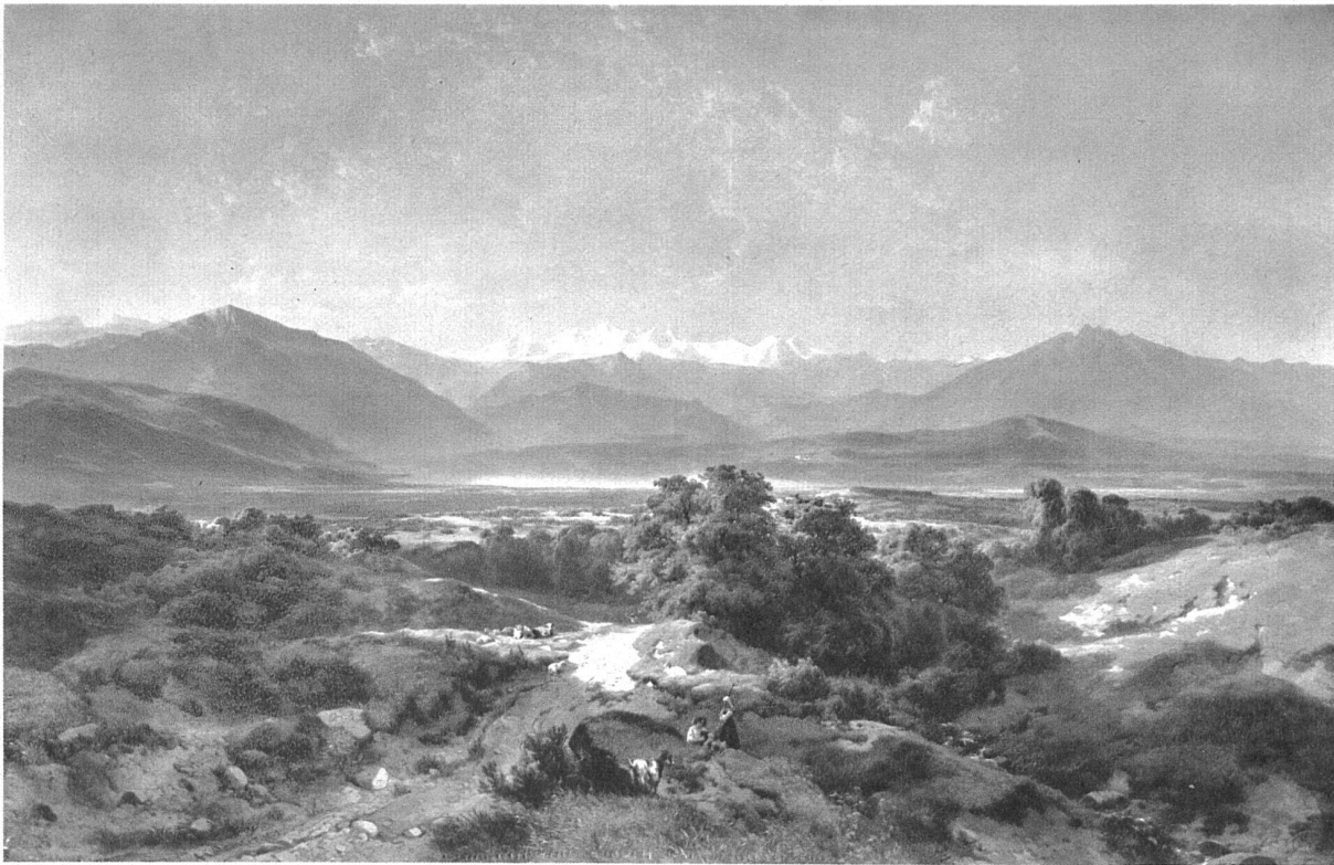
Alexandre Calame: Albisbrunn, 1849. 1,60 × 1,70 m., Musée de Neuchâtel

parisien qui lui inspira l'idée de son «Eboulement de rochers». Son «Reichenbach» comme son «Giessbach» sont des paysages combinés. Si la cascade se reconnaît, le site qu'elle anime est d'ailleurs. Dans sa première période surtout, Calame admettait des arrangements, des modifications. Il adoptait même tel procédé mécanique de l'école de David.