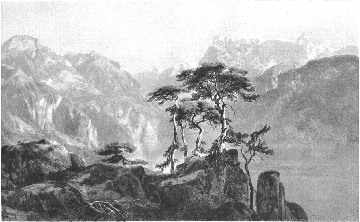
Alexandre Calame: Lac des Quatre-Cantons, Musée de Neuchâtel

cidental, à l'aspect dramatique de la montagne: l'orage, l'averse, le coup de vent, l'effet de nuit, de brouillard ou de première neige. Son «Eboulement de rochers» avec, sur la droite, le chalet détruit et, au premier plan, les habitants en larmes, est conçu dans un esprit tout proche de celui du «Tremblement de terre» de Léopold Robert. Esprit romantique, s'il en fut.