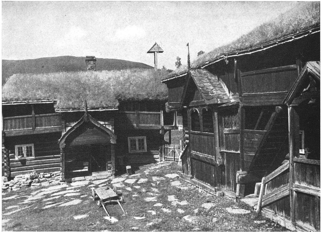
Hof Bjölsstad in Hedalen