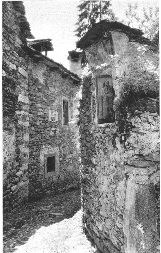
Arcegno bel Ascona.