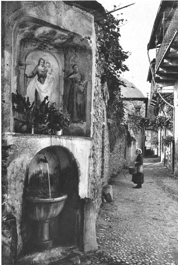
Losone bel Locarno