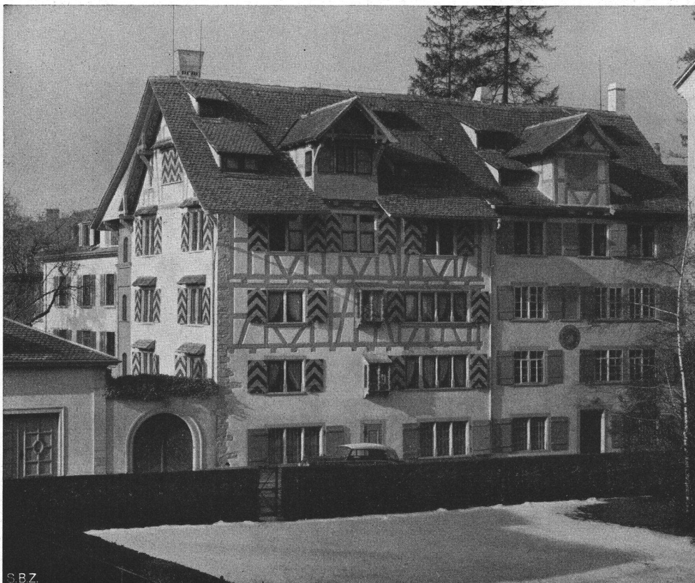
oben: Ecke Bäregasse- Talacker, im Vordergrund das Haus «Zur Arch». Ein Rest Alt-Zürich mitten in der Großstadt