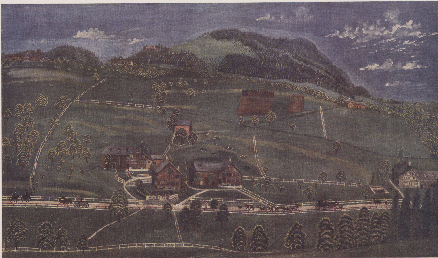
7. „Thal“ mit Rosenberg bei Herisau, von unbekannter Hand.