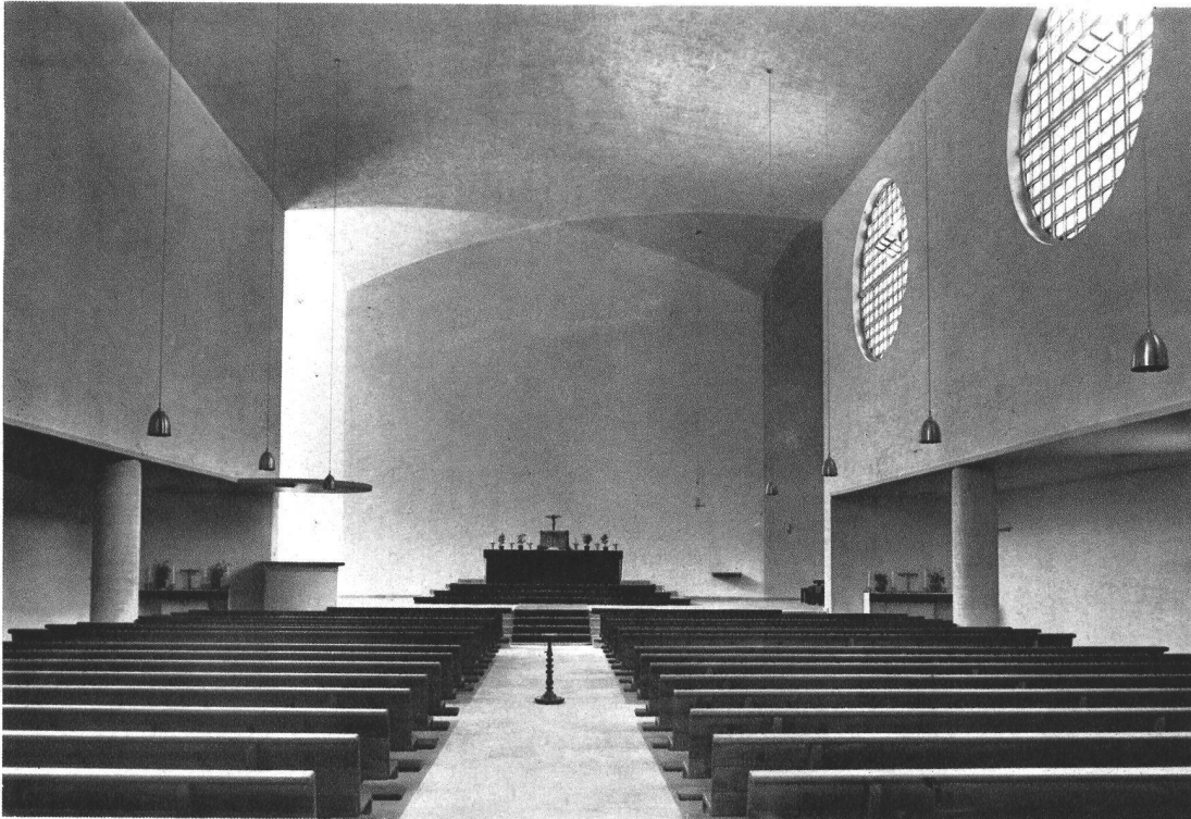
Blick gegen Chor

Bodenbelag in den Gängen des Schiffes und im ganzen Chor Bündner Gneissplatten, naturgespalten. Säulen, Unterbauten der Seitenaltäre und Postamente der Kommunionbank in Othmarsinger Muschelkalkstein. Hauptaltar samt Stufen, Seitenaltarplatten, Kommunionbankplatten in Serpentin. Der Tabernakel, in Bronze vergoldet, ist eine Arbeit des Bildhauers Albert Schilling. Wände und Decken in rauhem Kalkabrieb.