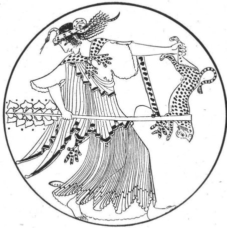
Mänade. Innenbild einer weissgrundigen Schale des Töpfers Brygos. 1. Viertel des V. Jahrhunderts v. Ch.

vollkommen originalen Zustand entgegen — viele beschädigt, an einigen ist die Farbe stellenweise abgesprungen oder verblichen, viele sind vollkommen frisch wie sonst nur noch Münzen, die aber ein thematisch viel enger begrenztes Gebiet sind und zeitlich lange nicht so hoch hinaufreichen. Und zudem sind die Vasen aller Epochen immerhin in so grosser Zahl gefunden worden, dass die Gesetzmässigkeit ihrer Entwicklung im grossen heute klarliegt, soviel im einzelnen noch unklar ist.