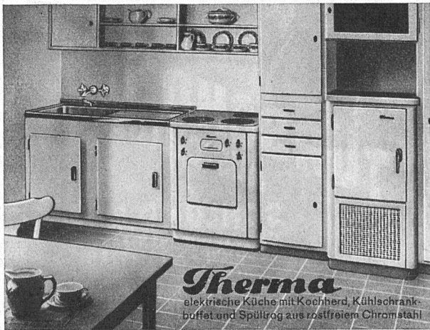
Therma elektrische Küche mit Kochherd, Kühlschrank- buffet und Spülrog aus rostfreiem Chromstahl