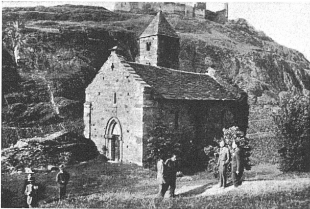
Allerheiligen-Kapelle am Aufstieg zur Kirche Notre Dame de Valère