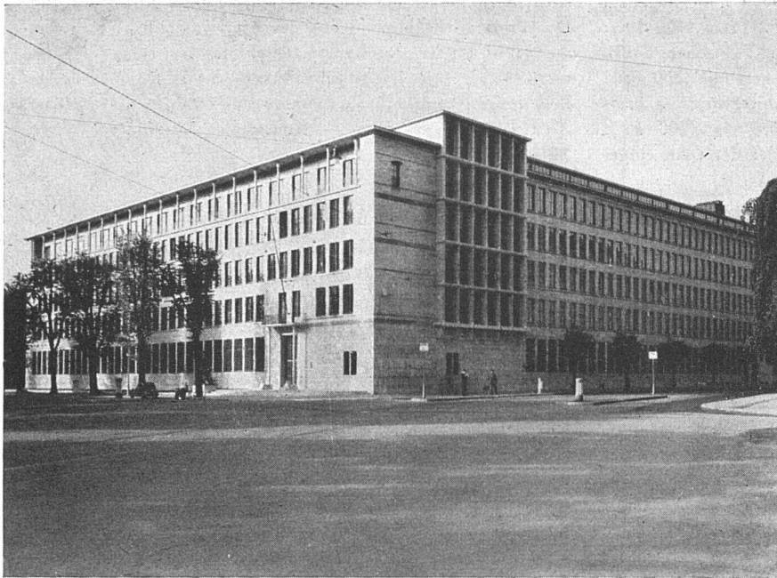
Schweizerische Lebensversicherungs- und Rentenanstalt Zürich Architekten: Gebr. Pfister, Zürich

Terrassenbeläge zirka 1000 m 2 Isolation der Kellerräume gegen Grundwasser zirka 4500 m 2