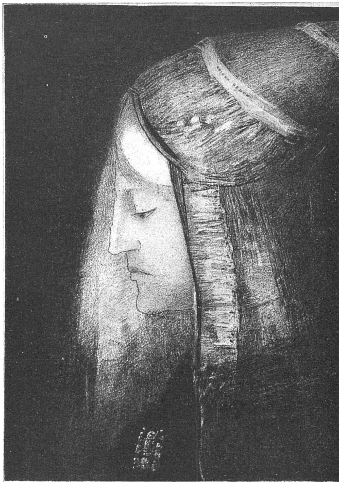
«Profil de Lumière»

hellster Bewusstheit. Auch hier zwischen Kopf und Schwanz fast kein Körper: Anfang und Ende, Ur-anfang und Letztes; wenig Mitte, nur extreme Ge-spanntheit; auch im Kleinsten.