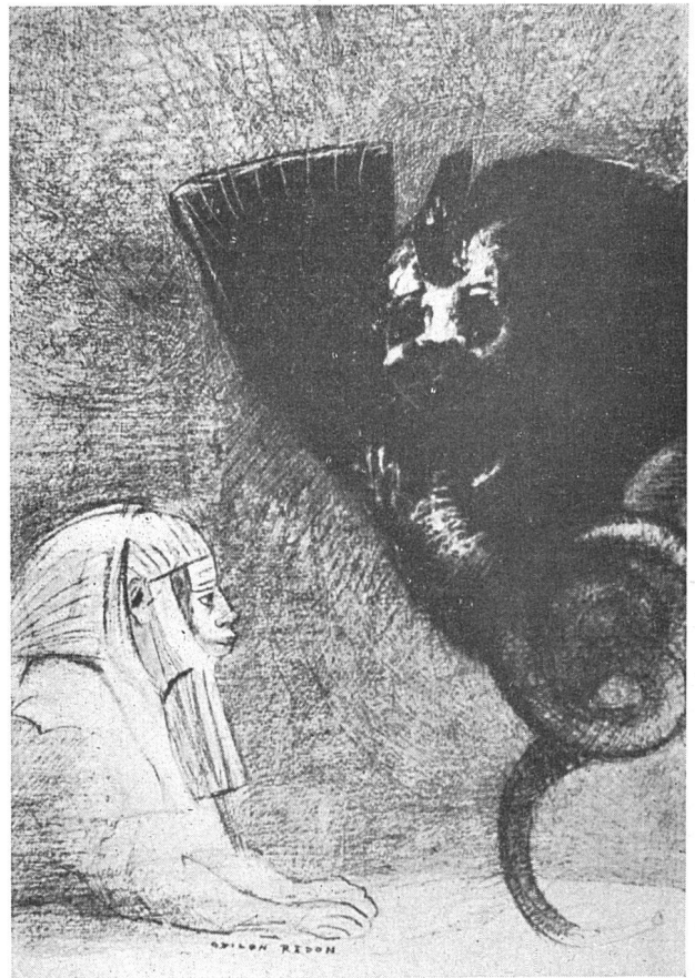
«Sphinx et Chimère» aus der Folge 1889 zu «Les Tentations de St. Antoine» von G. Flaubert

Jene Vorstellung ist sogar relativ häufig. Eine Legende von Mantis, dem höchsten Gott der Hottentotten, lautet z. B. so: sein jüngstes Kind wurde von Affen getötet. Um es wieder zum Leben zurückzubringen, hielt er eines seiner Augen drei Tage unter Wasser;