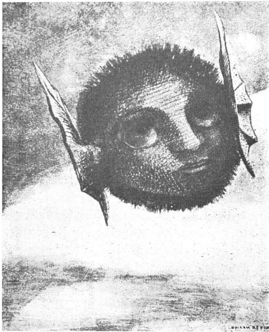
«Gnome» aus der Folge «Dans le Rêve», 1879

Mit seinen graphischen Mitteln kann er auch intensives räumliches Empfinden darstellen; sei es wie im «Gnome», mit wenigen Strichen das Atmosphärische und die Weite durch ihren Gegensatz zu dem geballten Kopf; sei es, wie im Blatt aus der Apokalypse, den Raum um Gott in den Andeutungen des Regenbogens und mit einigen dunklen Reflexen über dem Wasserspiegel im Vordergrund; sei es in dem intensiven Spiel von Licht und Schwärze wie in der «Sphinx et Chimère»; sei es, wie sich das «Profil de Lumière» aus dem Dunkel zu einem Hell-Geistigen formt.