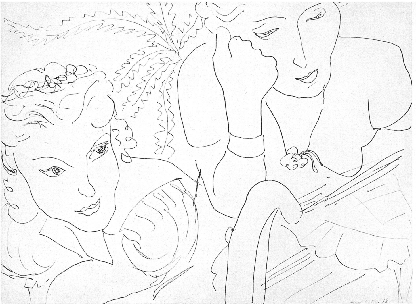
Henri Matisse Federzeichnung 1938