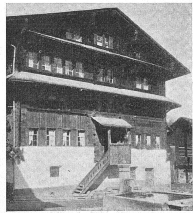
Großhaus in Elm. Giebel und Ausbau des 3. Geschosses aus dem Jahre 1587. Der übrige Bau ist älter

wirtschaftliche Bauamt Brugg – Einzelhöfe und ganze landwirtschaftliche Siedlungen.