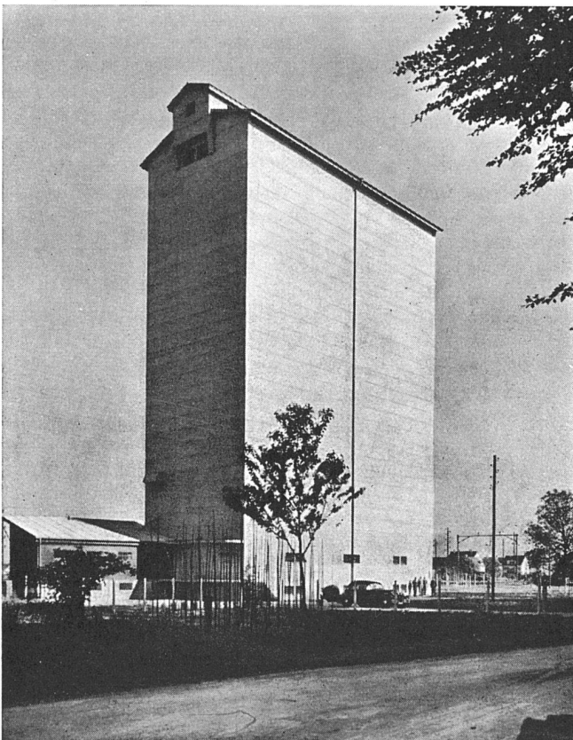
Neuer Silo der Neumühle Töb Ing. Büro A. Wickart & Co., Zürich

FERMETAL AG. für Metalldichtungen ZÜRICH, Sihlstraße 43 Telephon 3 90 25