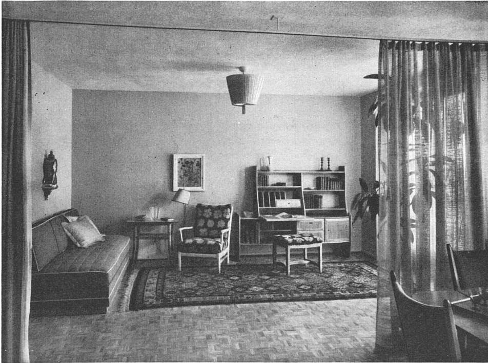
Studio einer Dame. Trennbar durch leichten Vorhang vom Wohnraum-Teil. Möbel aus hellem Kirschbaumholz. Couch verwandelbar in Bett.

Wir stellen nicht nur Möbel für Privaträume her; wir übernehmen auch den Innenausbau und die Möblierung von Direktions- und Geschäftsräumen. Auch beim Neubau „Nationalzeitung“ waren wir beteiligt