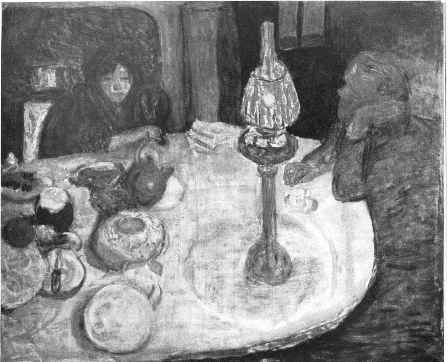
Pierre Bonnard Intérieur