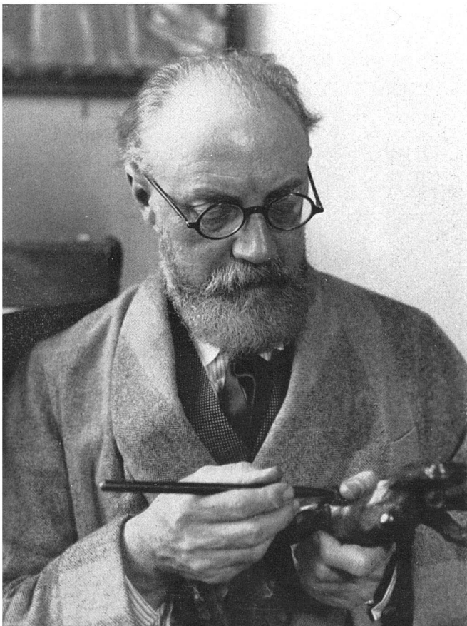
Henri Matisse

und in der scheinbar gefährlichen Ausschweifung bezieht er seine Sicherheit gerade aus ihr. Seine Zeichnung wirkt auch oft wie ein verlebendigtes Muster; sie tritt hin und wieder nur noch als eine bloße Dekoration auf. Und doch ist sie auch dann noch auf eine kühle Weise beseelt. Die Arabeske ist das Ergebnis einer letzten Konzentration. Die Zeichnung von Bonnard hingegen wirkt anders. Auch sie rechnet mit der Fläche, die zur Verfügung steht, aber sie hebt diese auch fast immer auf und führt in den Bildraum hinein. Sie ist voll heimlichen Jubilierens und voll reicher Melodie. Der ganze Wohlklang des französischen Rokoko scheint darin noch einmal aufzuleben.