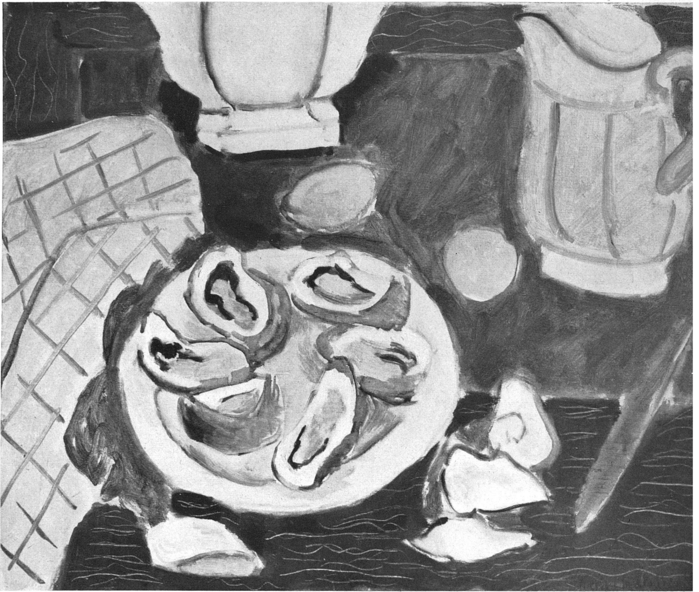
Henri Matisse Aus

Reize. Er hat es auf jeder kleinsten Fläche nicht einmal, sondern unzählige Male gestreichelt: mit dem Pinsel geliebt. Auf jeder kleinsten Fläche ist sein zeichnerischer und farbiger Humor lebendig: die schöpferische Drolligkeit, die überall das Unerwartete sieht, und dieses Unerwartete dann naiv und selbstverständlich wiedergibt. Darum tritt dieses Unerwartete auch immer und überall mit absoluter Sicherheit auf.