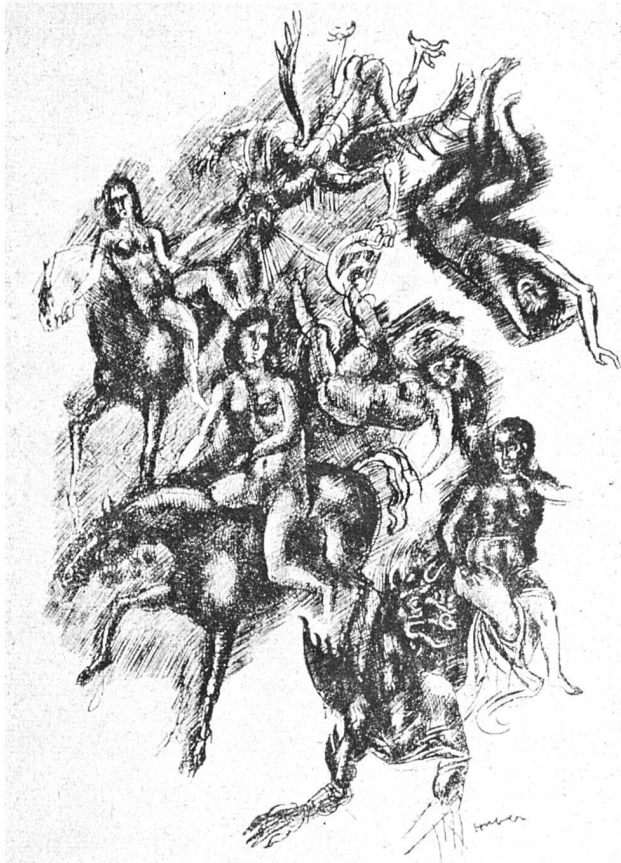
mann Huber Federzeichnung 1915