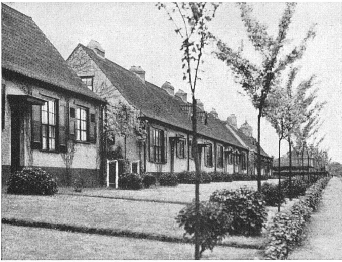
Offene Vorgärten in einer Siedlung in Brüssel

grundsätzlich niedriger, da der Garten blickmäßig schon durch die Pflanzung abgeschlossen ist, und vor allem weniger aufwendig als früher, bevorzugen gehobelte Vierkantlatten oder einfache geschmiedete Vierkantstäbe mit geringster Unterteilung durch Pfeiler und Pfosten. Das verzinkte Drahtgeflecht empfehlen wir dann, wenn es für das Auge im Grün der dahinter gepflanzten Hecke oder im Laubwerk üppig wachsender Schlingpflanzen (Efeu, Geißblatt, Wilder Wein u. a. m.) verschwindet. Hinter weitmaschigem Drahtgeflecht entwickeln sich Heckengehölze, da beidseitig voll belichtet, gut und gleichmäßig, vor Mauern hingegen, wo man sie leider allzu oft sieht und wo sie an und für sich vollkommen sinnlos sind, werden sie einseitig verkümmern.