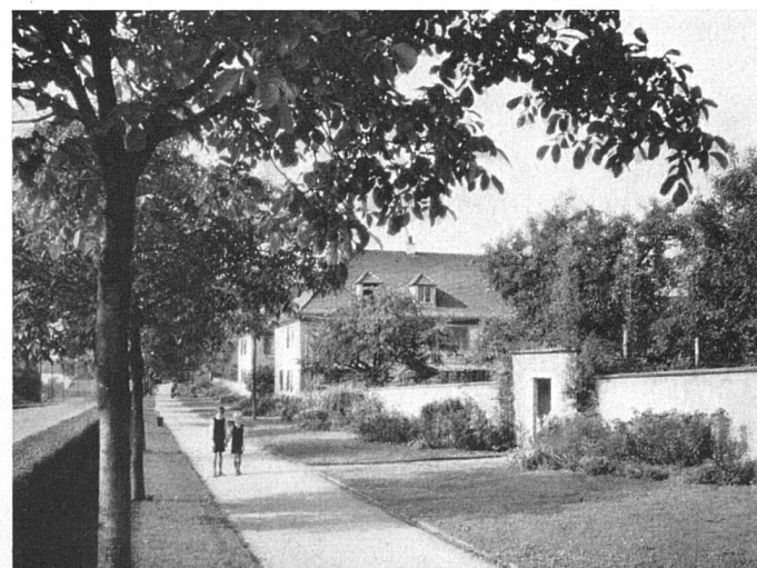
Gartenabschluß mit lockeren Hecken Siedlung Neubühl