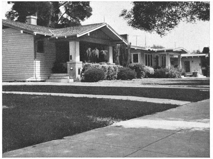
Zaunlose Gärten in nordamerikanischem Villenviertel

Wie wir für den Wohngarten in der Stadt grundsätzlich einen dichten Abschluß nach außen verlangen, so verneinen wir ihn für den Vorgarten . Der Raum zwischen Bauflucht und Straßentrucht, dieser Streifen von ungefähr 3–6 m Breite, ist nicht zu einem persönlichen Gärtchen auszubilden, in dem man aus naheliegenden Gründen doch nicht wohnen kann, sondern er ist nach der Straße zu öffnen, er gehört visuell zur Straße und damit zur Allgemeinheit. Wir denken dabei an Wohnstraßen, auch an Straßenzüge in Industriebezirken, die nach städtebaulichen Überlegungen bisweilen breit geplant aber vorerst schmal ausgebaut werden. Bei geschlossener Bauweise, beim Zeilenbau, sind die Vorgartenstreifen ohne jegliche Unterteilung einheitlich zu behandeln, und zwar bevorzugen wir bei entsprechender Tiefe die schlichte Rasenfläche, die eben ist oder leicht gegen die Häuser ansteigt, zu denen zwanglos Stauden, Sträucher und Schlingpflanzen überleiten. Die einzige Begrenzung straßenwärts bildet dann eine Kante aus Naturstein, die um wenige Zentimeter höher liegt als der Gehweg. Wo man glaubt, damit kein Genüge zu finden, begrenzt man den Rasen durch ein 40 cm hohes Mauerchen oder eine niedrige Hecke, für die sich zum Beispiel Berberitzen gut eignen. Es ist selbstverständlich, daß bei ganz besonders schmalen Vorgartenstreifen an Stelle des Rasens eine einheitliche niedrige Strauchpflanzung tritt. Bei offener Bauweise und üblicher Vorgartentiefe wird der Straßenraum in der glei-