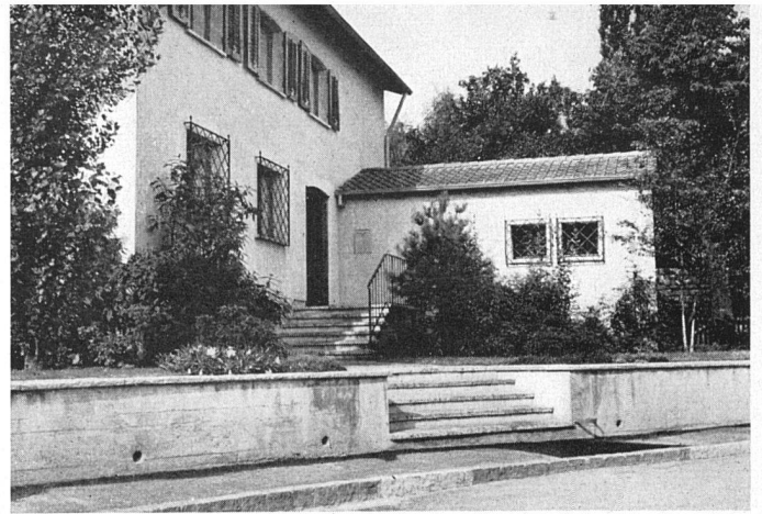
Offener Vorgarten mit niederer Mauer