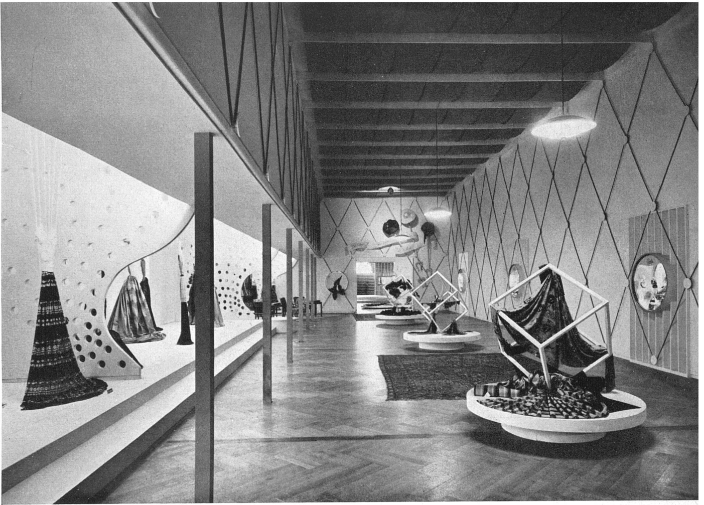
Ausstellungsraum (10) «Seide» Einzelausstellung