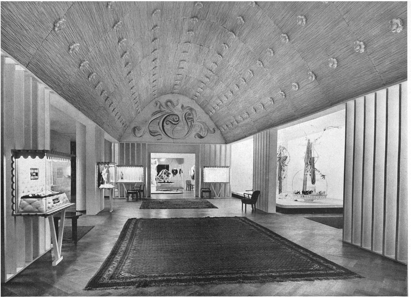
Vorraum Kongreßsaal (12) Uhren, Schmuck, Repräsentative Modevorführungen