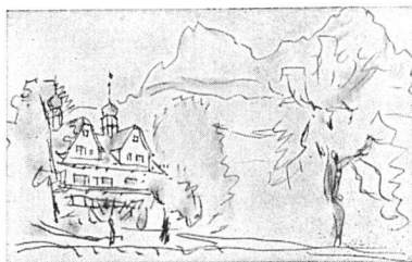
Schwyz Redinghaus und Mythen