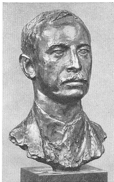
Karl Geiser, Bildnis Prof. P. Karrer. Aus der Ausstellung «Schweizer Kunst der Gegenwart» im Kunstmuseum Winterthur.