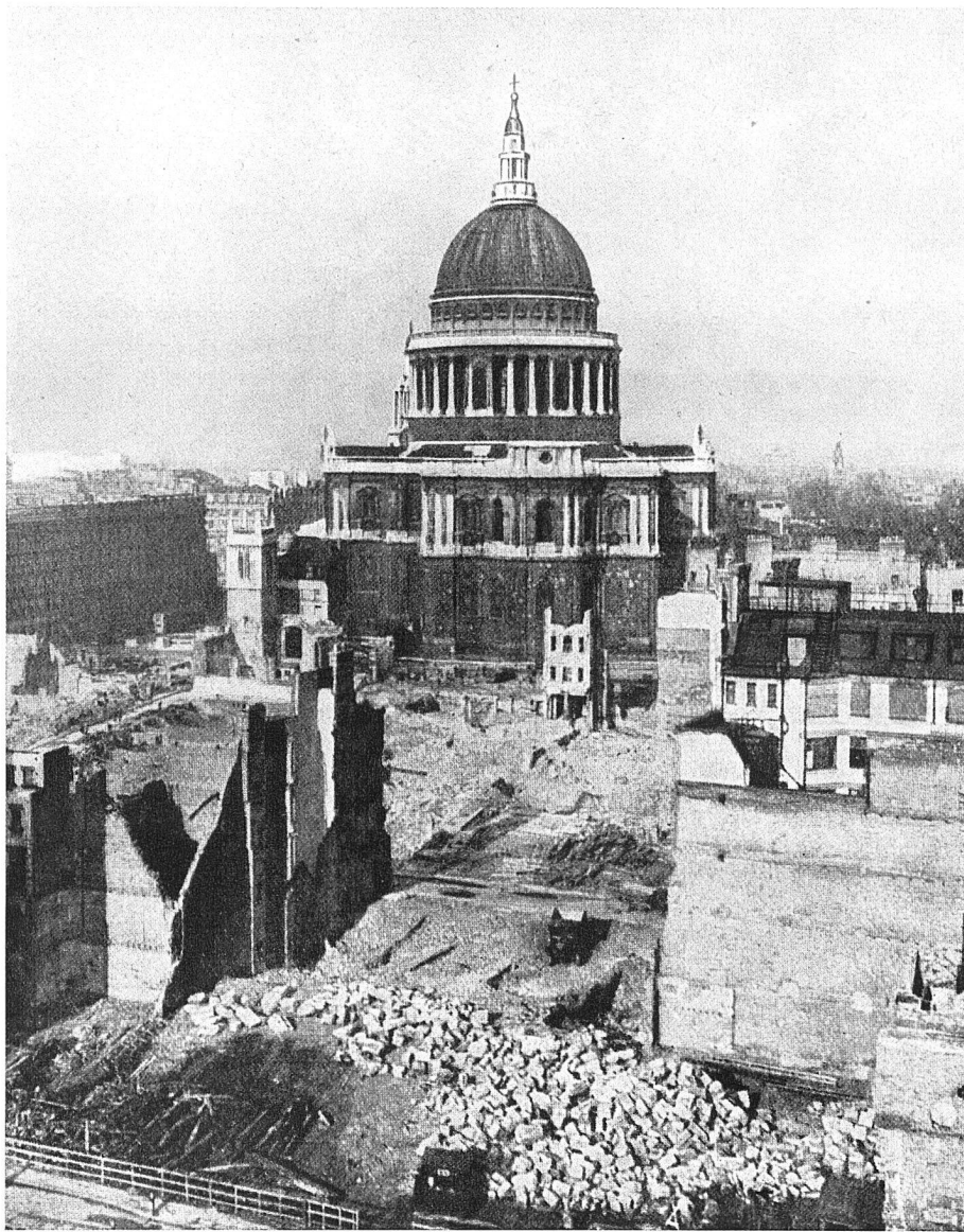
«Ein Unglück – eine Gelegenheit» (London St. Paul's Cathedral)