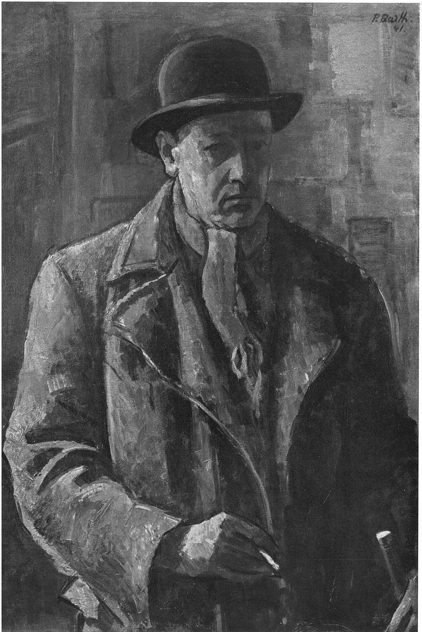
R. Baskin 41. The Man in the Bowler Hat. Oil on canvas. 1941. Collection of the artist.