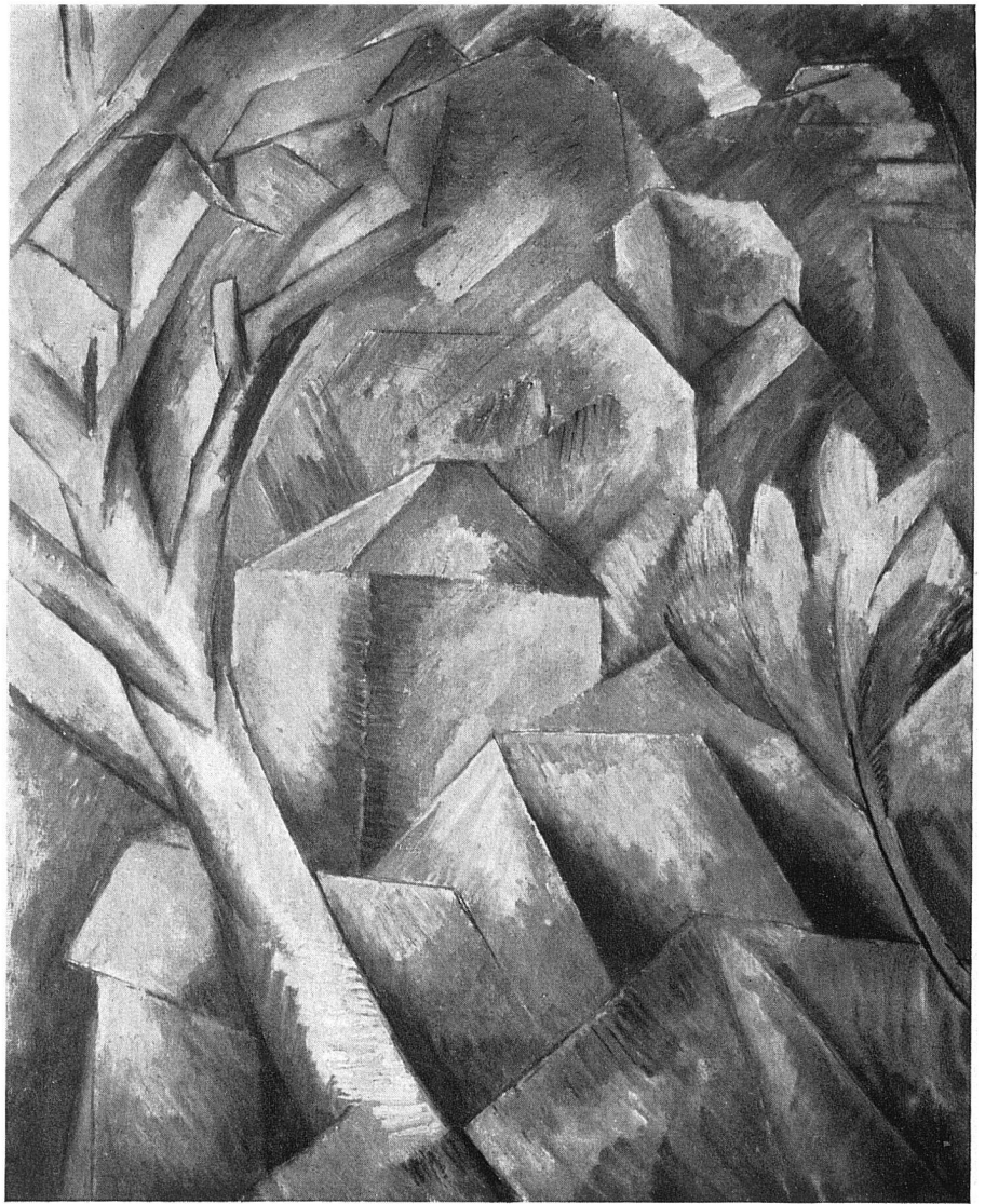
Georges Braque Maisons sur la colline 1908 (Abb. 1)

licher Anwesenheit sind getilgt, die Häuser sind fensterlos, als wären sie Kristalle, durch Kräfte des Erdinnern vor Urzeiten geschaffen. Es geht hier nicht mehr um die Beziehung des Menschen zur Landschaft als zu seiner Umgebung, sondern um die Frage des gemeinsamen Gesetzmäßigen im Dasein jeglicher Kreatur.