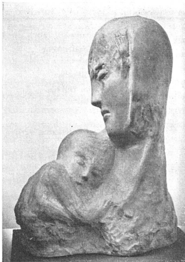
Wilhelm Lehmbruck. Mutter und Kind. Aus der Ausstellung in der Kunsthalle Basel