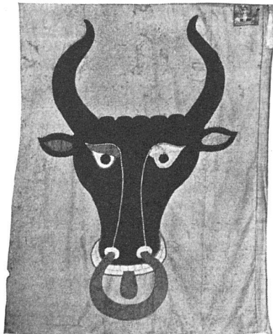
Landesbanner von Uri, 15. Jahrhundert, Rathaus Altorf

Außer diesen offiziellen Fahnen, zu denen auch die alten Zunftfahnen gehören, gibt es aber noch die Vereinsfahnen, die im heutigen Leben und Treiben im Vordergrund unsres Interesses stehen. Man hat es lange fast als Selbstverständlichkeit hingenommen, daß ihre Herstellung mit wenig künstlerischem Geschmack geschah. Wohl aus der unbewußten Erwägung, daß es sich nicht in erster Linie um die Wirkung von weitem handelt, hat man der Vereinsfahne einen mehr sinnlich-beschaulichen Charakter verliehen, oft mit poetischen Zutaten und literarischen Reizen gespickt, die aber meist jede künstlerische Note vermissen ließen. Die Gründung von Sängervereinen, Schützen- und Turnvereinen — etwa vor hundert Jahren — fiel in eine Zeit, die in der Kunst mehr das inhaltliche Motiv schätzte und suchte und auf die Anschaulichkeit der Formen und die Harmonie der Farben nicht allzuviel Gewicht legte: Wappenschilder, Landschaften, umrankt von Alpenrosen und Edelweiß, Lorbeer und Eichenlaub, Darstellungen des Tell, der heiligen Cäcilie, Radfahrer, Schwinger, Trompeter, Sprüche usw. Es war nicht bloß das einzelne Motiv, das kitschig war, sondern die Komposition als solche. Je mehr auf der Fahne stand, umso besser er-