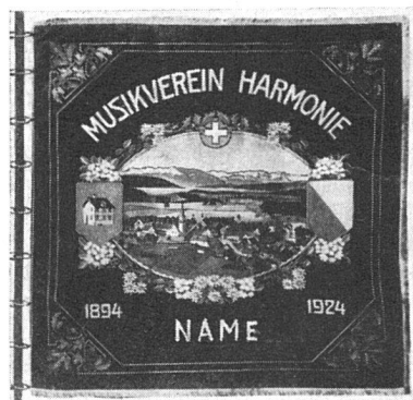
Gegenbeispiel: Vereinsfahne von 1924