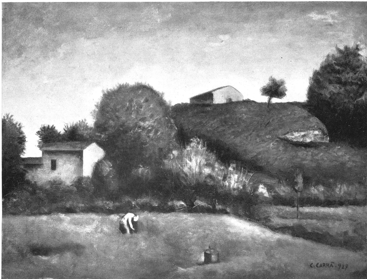
Carlo Carrà Paesaggio 1927

au premier plan, un tréteau emprunté à quelque Marine de Seurat (Seurat et Gauguin, d'une façon ou de l'autre, ont laissé des traces dans la production de Carrà et l'on verra de quelle sorte). Si cette fois le paysage remplace les mannequins, le travail de transfiguration est en substance le même; en d'autres termes, Carrà rend le paysage avec la force de synthèse d'un primitif. On s'aperçoit qu'il a étudié certains fonds des fresques de Giotto à Assise et à Padoue et qu'il en a tiré l'exacte leçon, sans tomber toutefois dans un stylisme dangereux, où l'émotion suscitée par le spectacle de la nature aurait sombré sans remède.