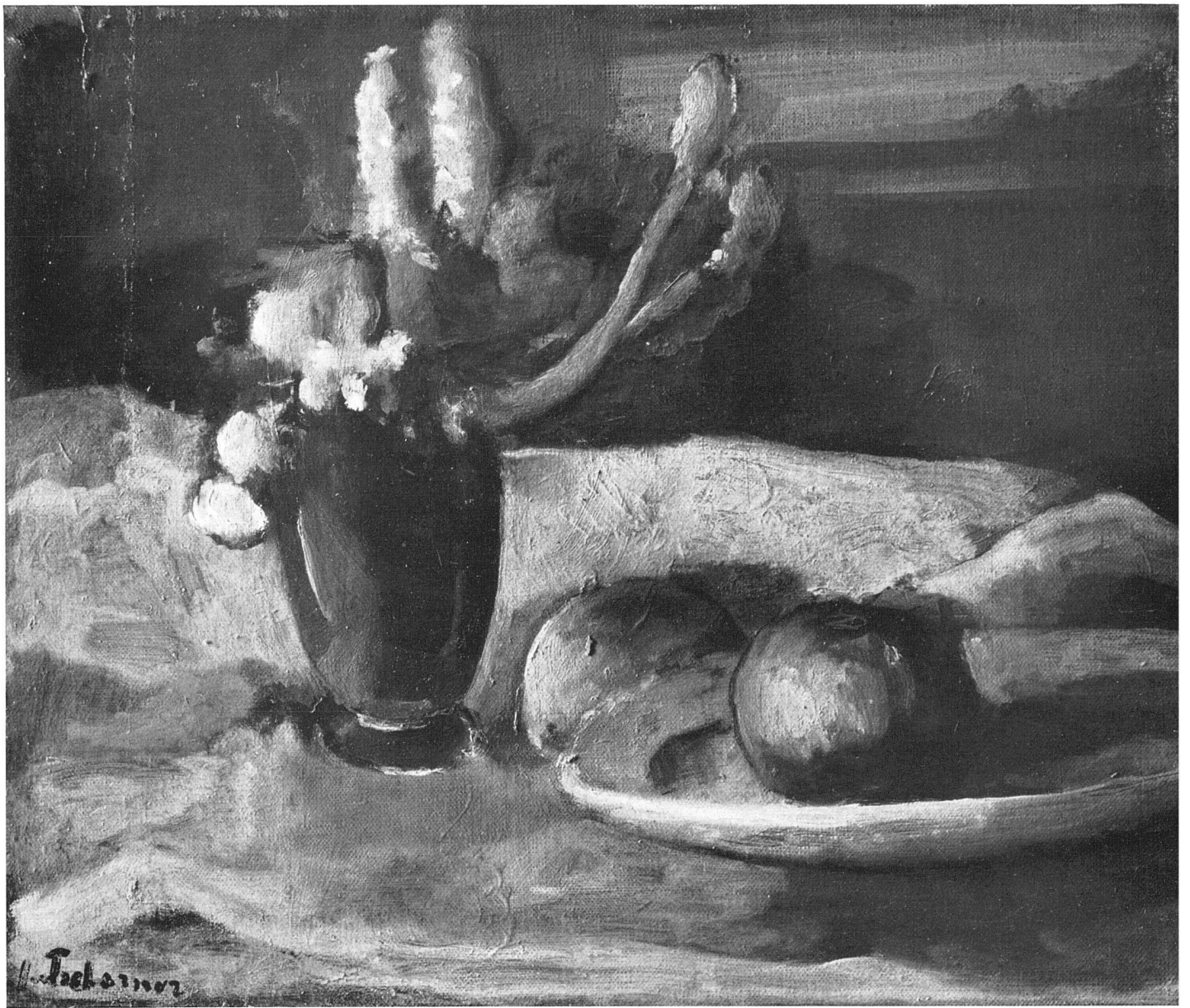
Johann von Tscherner Stilleben 1944