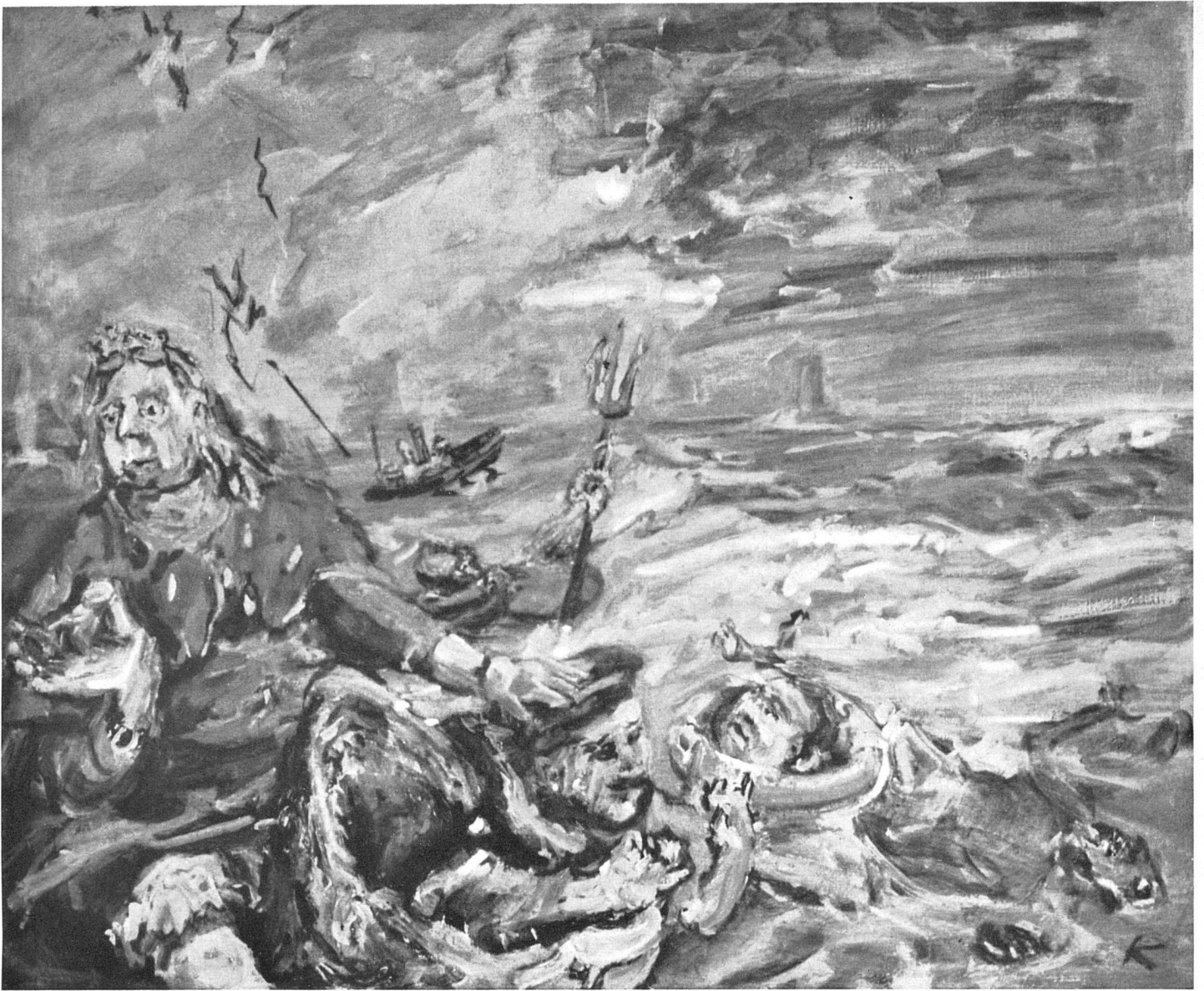
Oskar Kokoschka Lorelei