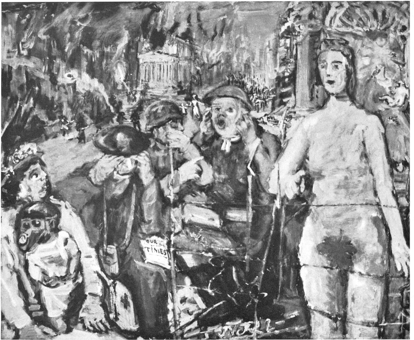
Oskar Kokoschka Alice in Wonderland

grund, in der linken Ecke des Bildes, schaut die erstaunte Menschheit zu: in Gestalt einer Mutter mit ihrem Kind, dessen Gesicht von einer Gasmaske bedeckt ist. Die drei Männer sind um die nackte Gestalt gruppiert. Sie nehmen Anstoß an der Nacktheit der Wahrheit, nicht am Untergang.