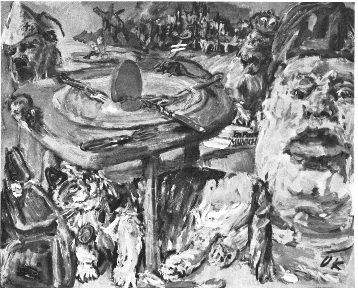
Oskar Kokoschka Das Osterei