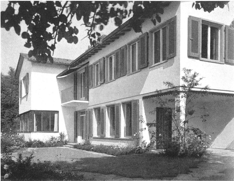
Ferienhaus bei Hertenstein Hans Luder, Architekt SIA, Solothurn