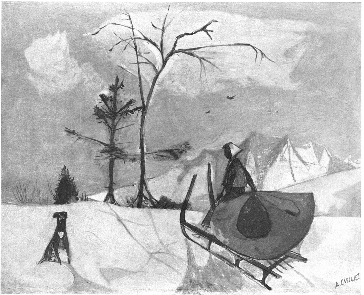
Alois Carigiet Winterlandschaft mit Schlitten