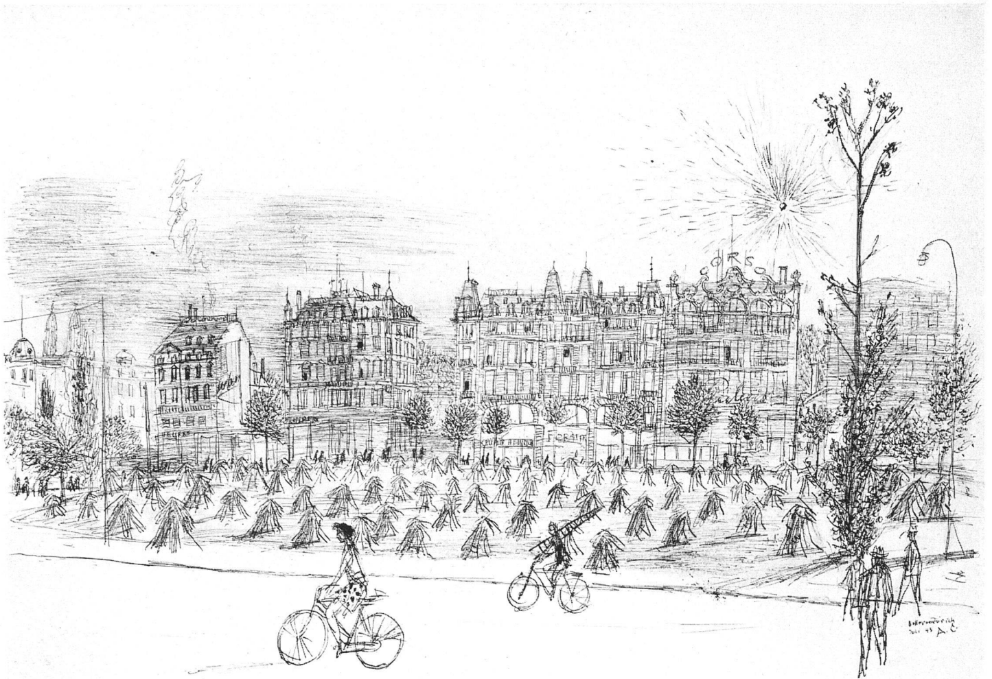
Alois Carigiet Bellevueplatz in Zürich 1943 Lithographie