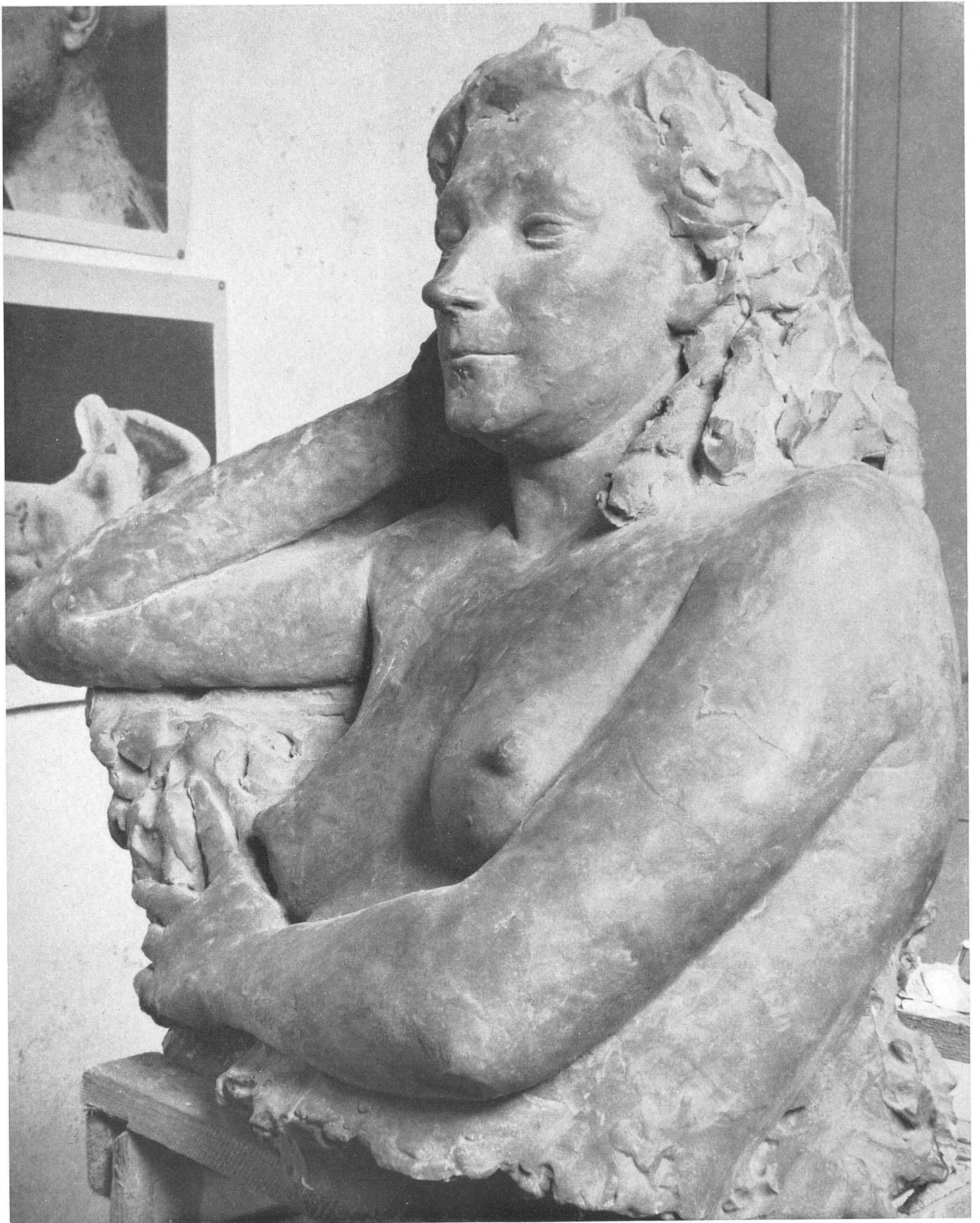
Giacomo Manzù Busto di Carla Bronze 1941