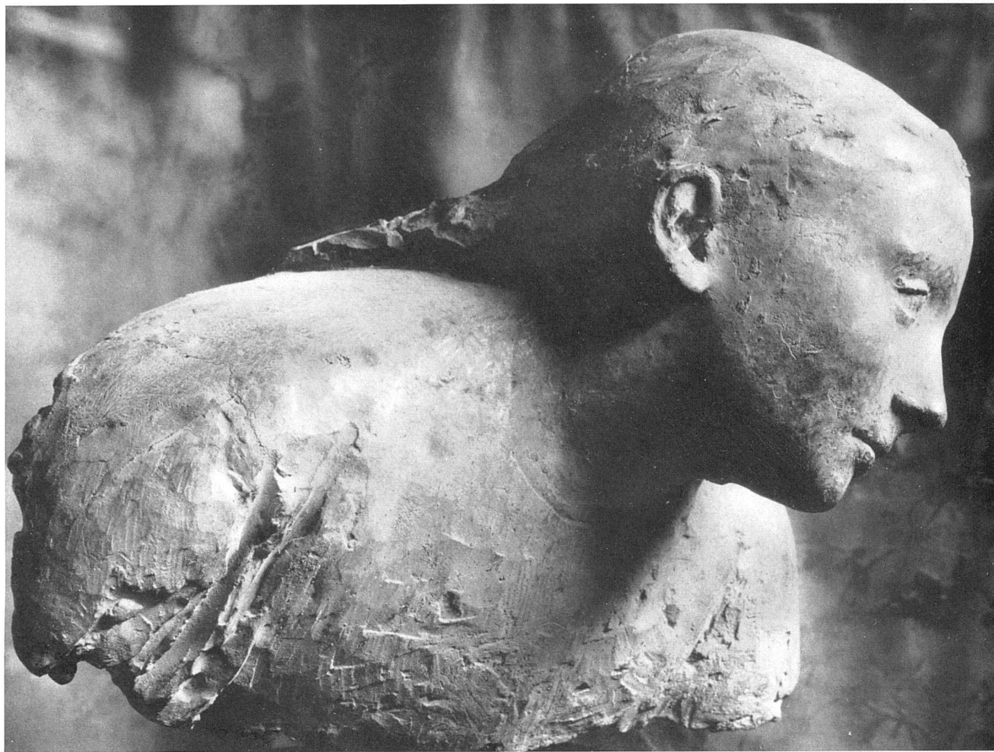
Giacomo Manzù Bambina alla Finestra Bronze 1943