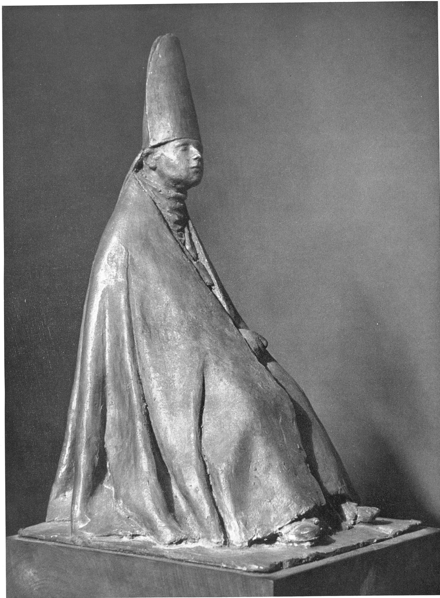
Giacomo Manzù Cardinalino Bronze 194