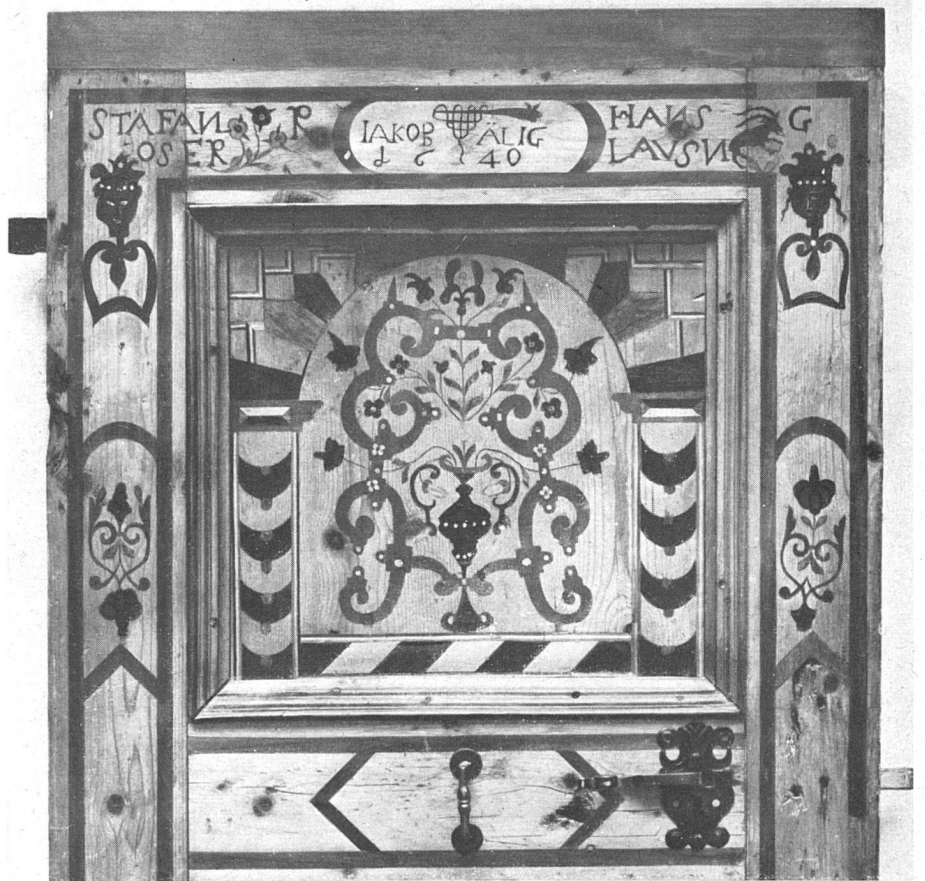
Abb. 3 Eingelegte Türfüllung Kandersteg 1640 Historisches Museum Bern

Was unter Vergröberung und Erstarrung verstanden wird, ist klar. Mit der Verlangsamung meint Freyer das Nachlassen einer formalen Spannung, das Zäherwerden einer flüssigen ornamentalen Bewegung, beispielsweise einer Wellenranke. Die künstlerische Energie des Maureskenornaments auf der Neuenstädter Truhe (Abb. 2) geht bei einer ähnlichen Darstellung auf der Türfüllung von Kandersteg (Abb. 3) völlig verloren. Die Truhe aus Neuenstadt muß als ein typischer kleinstädtischer Grenzfall zwischen Volks- und Provinzialkunst angesehen werden. Das Füllungsornament dürfte auf ein gleiches Vorbild oder direkt auf einen Ornamentstich zurückgehen. Der Sockel zeigt die gedrückten Formen der westschweizerischen Gotik des frühen 16. Jahrhunderts. Das Dekor der Rahmenleisten spielt in seiner Spannungslosigkeit unmittelbar hinüber in die Volkskunst.