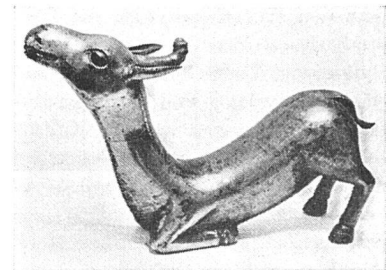
Einhorn. Indische Bronze des 16. oder 17. Jahrhunderts. Aus dem Kunstkalender des Holbein-Verlages