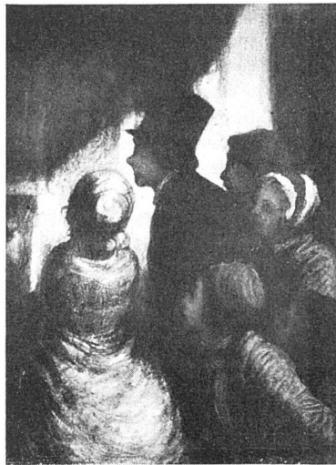
Honoré Daumier, Les Curieux

Es ist aber eine und wohl recht junge Fälschung. Rohe Pinselstriche im Himmel, die scheinbar zwanglose summarische Behandlung der Architektur, die voll Unsicherheiten steckt, die falsche Eleganz, mit der etwa der Zylinder des stehenden Herrn in einem Pinselzuge umrissen wird, die Zerfahrenheit in der Behandlung der Kleider, der mißglückte Kopf der Frau rechts im Bilde machen auf das halb freche, halb gequälte Taster des Nachahmers aufmerksam. Dem Werke des Meisters fremd sind auch die Schwächen der Komposition. Steif und beziehungslos stehen die Personen nebeneinander, und vollkommen abwesend ist jene Energie, mit der die Formen bei Daumier dem Rahmen einbeschrieben sind. Spannungslosigkeit ist überhaupt charakteristisch für dieses Bild: sie ist fühlbar im Anatomischen wie im Gange von Hell und Dunkel, ja sie ist auch der Erzählung eigen. Daumier stellt nicht dramatische Bewegung an sich dar, sondern er macht immer den eindeutigen Grund der Erregung deutlich. In diesem Punkte erscheint die müßige Sinnlosigkeit der Fälschung besonders klar. Die vier Personen, eine Dame, ein Herr im Zylinder, ein junger Ausläufer und eine Frau aus dem Volke, stehen hinter der Brustwehr des Seinequais nahe beisammen und blicken zum anderen