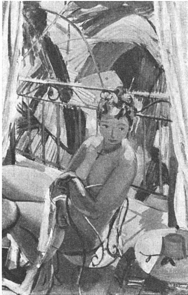
Maurice Barraud, Rose toute nue (1943) Aus der Solothurner Ausstellung.

«Sommer» von 1925, hat nun hier seinen verdienten Ehrenplatz gefunden. Dann hebt die stolze Reihe seiner Bilder aus Spanien an mit der «Spanischen Szene» und der großen Orangerträgerin, wo sich Barraud als geborener Wandmaler ausweist. Er hatte es zwar schon in den frühesten zwanziger Jahren getan mit dem unterdessen leider zerstörten, unvergeßlichen Raub der Europa, von dem hier aber eine erste Skizze wenigstens noch eine gültige Vorstellung ermöglicht. Der große Entwurf für die Ausschmückung der Luzerner Bahnhofshalle