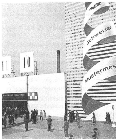
Eingangspartie der neuen Mustermessehalle 10/11. Fassadengestaltung: Rolf Rappaz SWB, Basel.

Verschiedene Verbände sind dieses Jahr offiziell vertreten, so der Verband der Schweiz.Kachelofenfabrikanten und Hafnermeister mit einer besonderen Beratungsstelle für Heizfragen, ferner die «Lignum» als Beratungsstelle für den Holzbau, die in einer leicht faßlichen Zusammenstellung die Normalisierung des Kantholzes und der Bretterware darstellt, und endlich das Technische Büro des Schweiz. Holzsyndikates. An Holzbauten interessiert das in natürlicher Größe ausgeführte «Herag»-Haus (Kosten Fr. 4500.-) der Firma Gribo & Co. AG., Burgdorf, und der schön durchgebildete Stand Jean