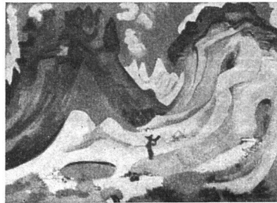
Ernst Ludwig Kirchner, Amselfluh