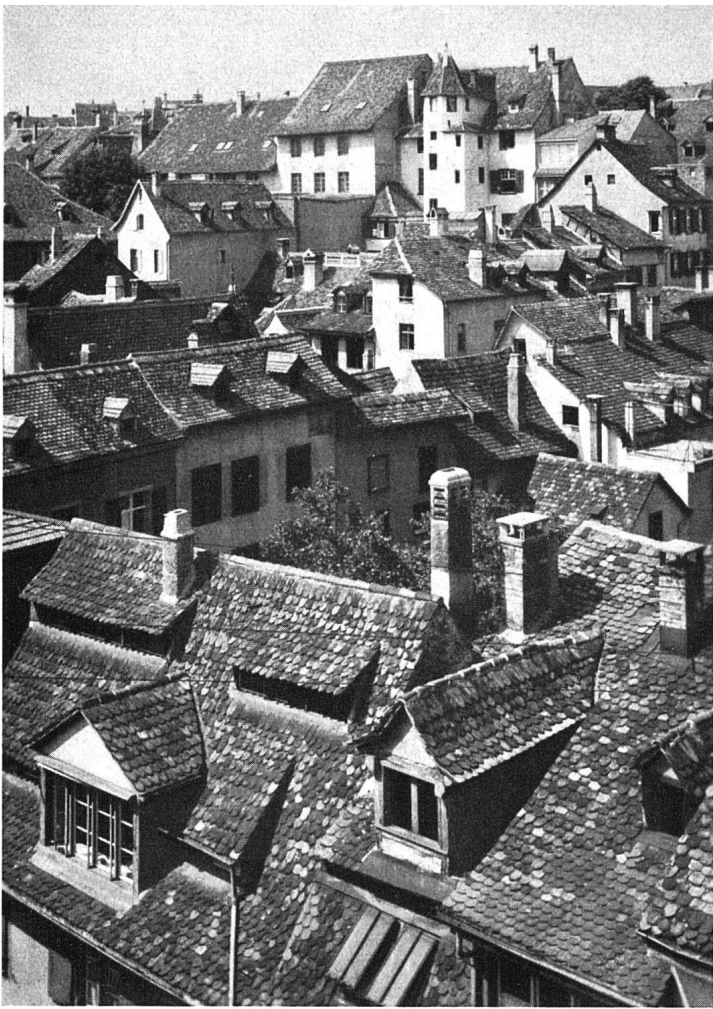
Basel, Blick über die Dächer der Altstadt. Die Baugvierte sind im Lauf der Zeit so gut wie vollständig überbaut worden