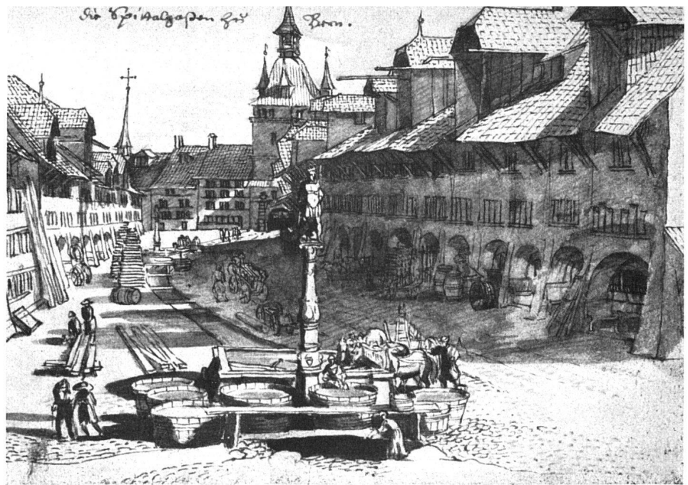
Bern, Spitalgasse um 1680. Die Altstadt aus der Zeit, da die Holzhäuser schon durchwegs durch Steinhäuser ersetzt worden waren