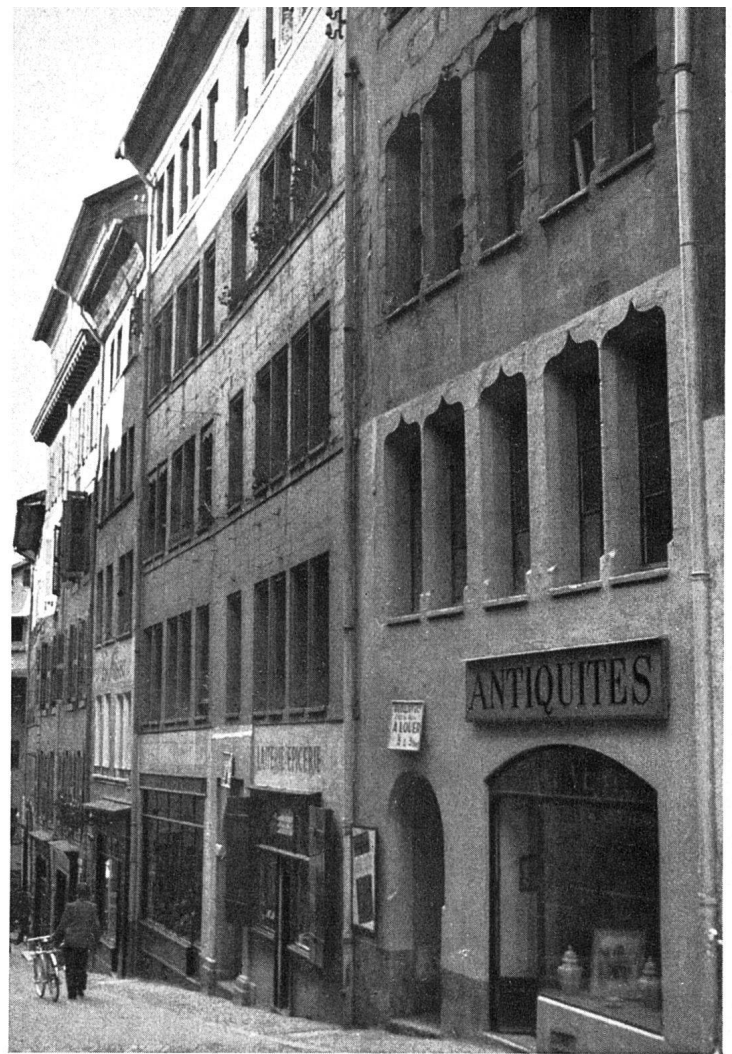
Genf, Straßenbild aus der Altstadt. Eine durch die Aufstockung der Häuser verengte und verdunkelte Straße

Möglich, wahrscheinlich sogar, daß eine bessere Zeit, eine Zeit, die der Arbeit ihren vollen Ertrag gönnt, die Alter und Armut nicht mehr als Synonym setzt, da eine Lösung findet. Vorläufig aber bleibt uns nichts übrig, wollen wir die Altstädte sanieren, als sie für unbewohnbar zu erklären und die Bewohner zu «exmittieren».