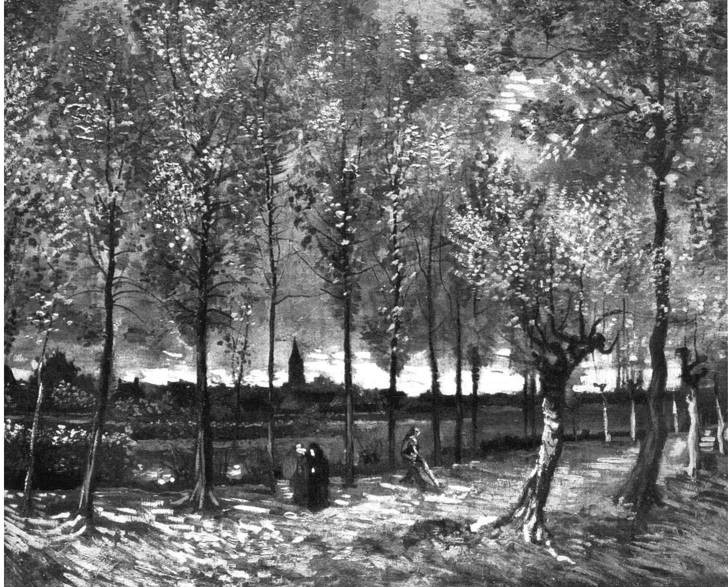
108: Spreng SWB, Basel