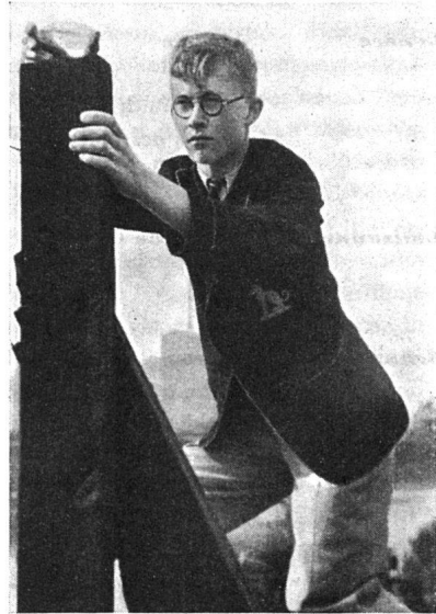
Schüler von Middlesbrough bei Bestimmung der Luftverunreinigung

und ihre Schulwege eingetragen sind. Eine ähnliche Aufgabe haben die Mädchen gelöst. Sie besorgten die entsprechenden Erhebungen über Geburten und Todesfälle, über die Verteilung der Ladengeschäfte und der Heime der verschiedenen Clubmitglieder und ihrer Clublokale. Auf diese Art helfen die künftigen Bürger Middlesbrough's mit, ihrer Stadt ein neues Gesicht zu schaffen.