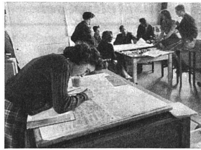
Planungsbüro in Middlesbrough

Das Messen der atmosphärischen Bedingungen in den auseinanderliegenden Stadtgegenden wurde einer freiwilligen Helferschar von Mittelschülern überbunden. Unter der Anleitung des Stadtanalytikers widmen sie sich mit Begeisterung ihrer Aufgabe. 35 Sekundarschüler haben während Tagen eine Verkehrszählung in der Innerstadt durchgeführt. Gegen 50 andere helfen bei der Bestimmung der Luftverunreinigungen. 30 weitere Schüler haben im Geographieunterricht Stadtkarten angefertigt, auf denen die Wohnungen der Schüler aller 30 Stadtschulen säuberlich aufgeführt