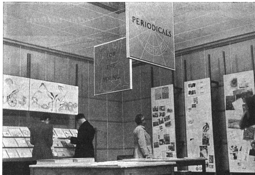
Schweizerische Buchausstellung in London, April/Mai 1946. Links Jugendbücher, rechts Zeitschriften (WERK). Architekt: E. F. Burekhardt BSA, Zürich; Graphiker: H. Steiner SWB, Zürich

Die Möblierung der Ausstellung besteht aus zusammensetzbaren Einheitsmöbeln, die in der Schweiz hergestellt wurden und in wenigen Stunden montiert werden können (Ausführung Rob. Strub SWB, Zürich). Die bombengeschädigten Hallen wurden mit einem Netz von weißen Kordeln, das die