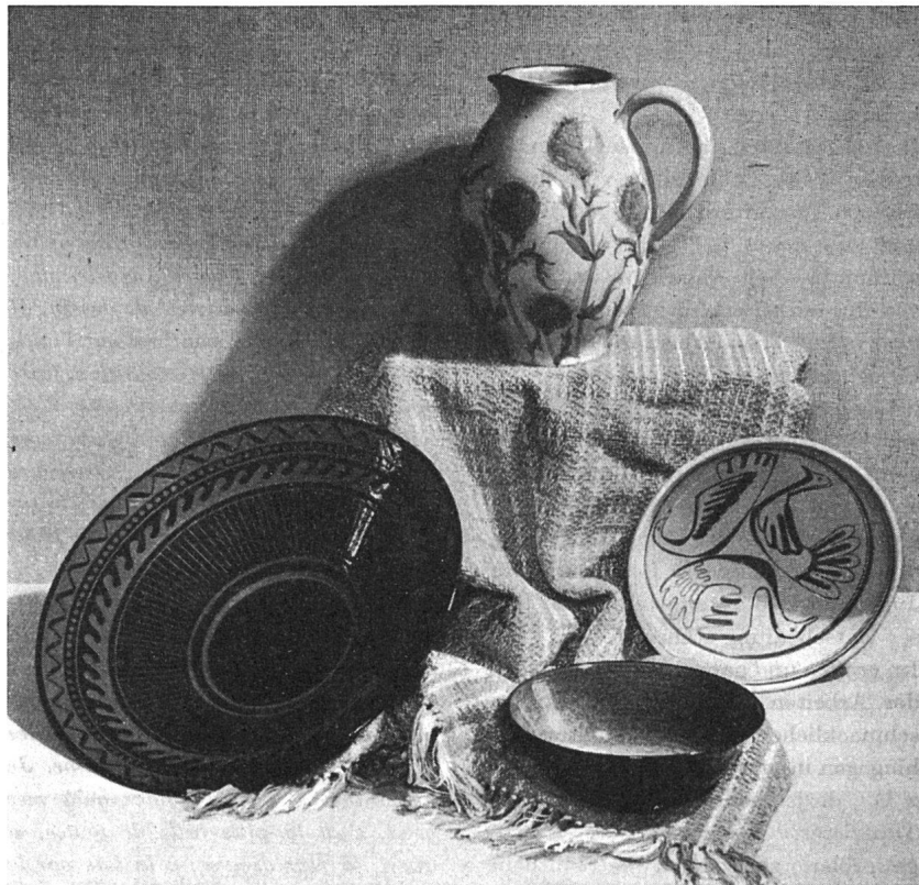
Städtischer Lehrlingswettbewerb Zürich 1945/46. Aus der Abteilung Keramik, 1.-3. Lehrjahr