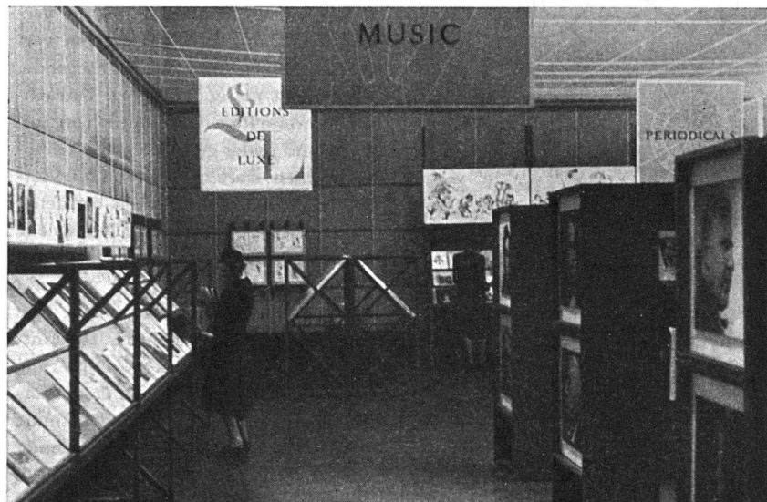
Abteilungen Musik und Bibliophile Ausgaben