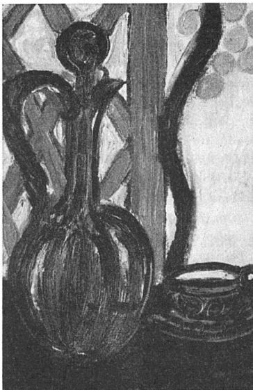
André Fougeron, Carafe et tasse de chine

Paris, wo er die Bekanntschaft mit Miro, Léger und Mondrian macht, in ihm reifen. Die diesjährige Ausstellung wurde durch die Initiative von Marcel Duchamps verwirklicht.