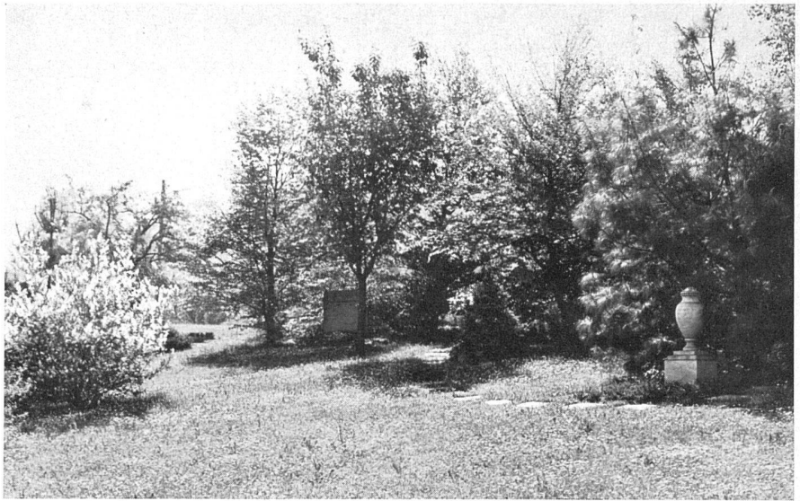
Familiengräber locker in Baumgruppen verteilt / Tombes de famille, arrangées librement entre les groupes d'arbres / Family graves, freely arranged around the groups of trees

Der Hang ist locker mit vorwiegend einheimischem Gehölz und Sträuchern bepflanzt mit vielen Föhren, z. T. auch innerhalb der Grabfelder. Die Bepflanzung verdeckt die unschöne Bebauung der Umgebung / La pente est plantée d'arbres et de buissons du pays en groupes librement disposés; beaucoup de pins, quelques-uns au milieu des rangées. La végétation cache les laids bâtiments environnants / The slope is loosely planted with predominantly indigenous trees and shrubs; many fir trees, some of them between the graves. The planting hides the ugly neighbouring buildings