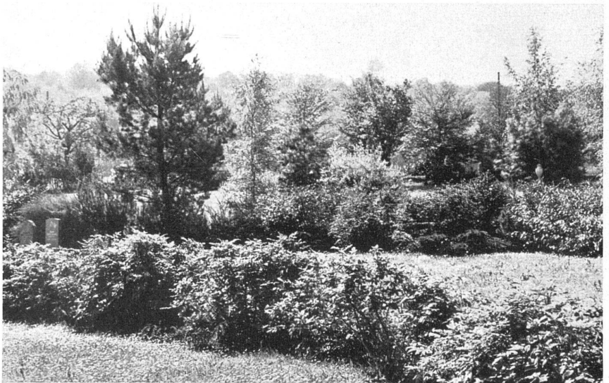
Noch nicht belegte Grabfelder mit Buschumrahmungen / Des secteurs encore libres, bordés de buissons / Unused plots surrounded by shrubbery