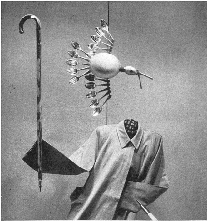
«Wandern». Dekoration: Ware / «Tourisme», composition d'articles / «Hiking», dressing with merchandise only