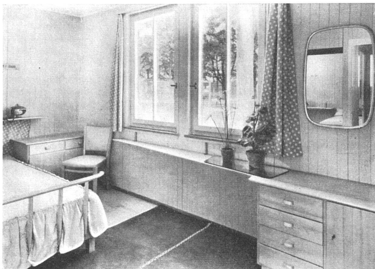
Vorfabriziertes Holzhaus «Cottage» der Genossenschaft für bernische Export- und Siedlungshäuser, Bern, ausgestellt an der Exposition Internationale de l'Urbanisme et de l'Habitation, Paris 1947. Architekten: H. Schwaar BSA, H. und G. Reinhard BSA, Bern. Möbel der Firma Anliker, Langenthal

Verfasser oft und oft auf die immerwährenden Geldwertschwankungen zu sprechen kommt – den Grund der Gründe eben jener Schwankungen der Wohnungsproduktion –, glaubt er doch, die Regulierung der Wohnungsproduktion und nicht der Herstellung von Zahlungsmitteln empfehlen zu sollen. So begreiflich ein derartiges Verlangen ist, – es wäre doch wohl richtiger, alles zu tun, damit die Reglementierung der Kriegszeit abgebaut werden können und nicht aufgebaut. B.