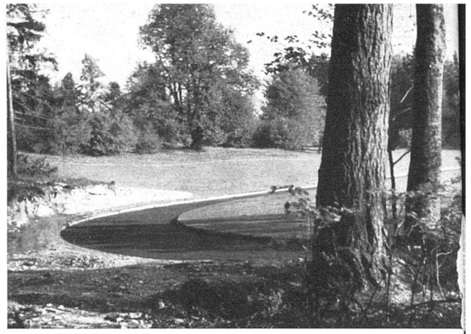
Kurve der Laufbahn / Une courbe de la piste / A curve of the